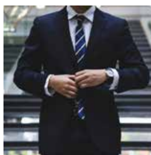
Dirección y Gestión