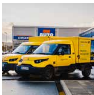
Comercio y Logística