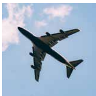
Aeroportuaria y Aeronautica