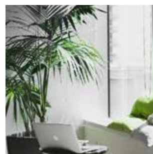
Marketing y Comunicación